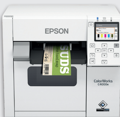
Gamme ColorWorks C4000e